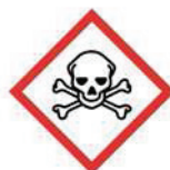
Giftig Sehr giftig