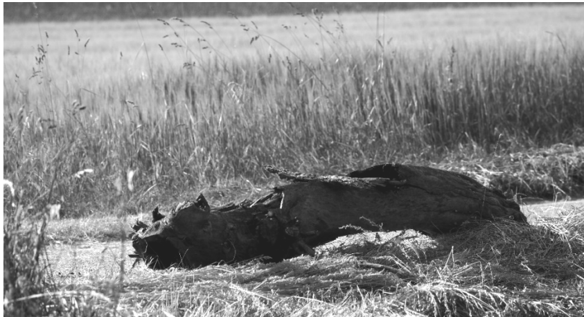
Kriechendes Totholzmonster oder umgefallene Hexe?

Beeindruckend ---Phantasie anregend --- rätselhaft