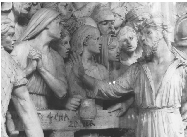
George Tinworth, 1880