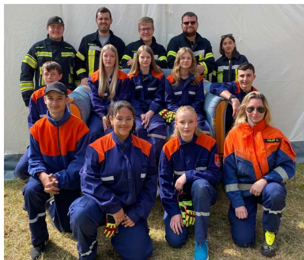
Gruppenfoto: Steffen Horn Text und weitere Fotos: Jugendfeuerwehr Sommerhausen