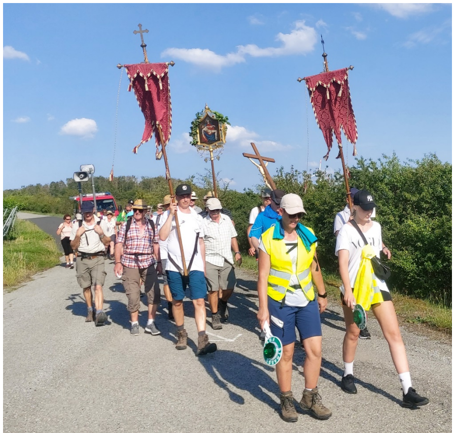
Dettelbachwallfahrt 2023 – letzte Meter vor Eibelstadt