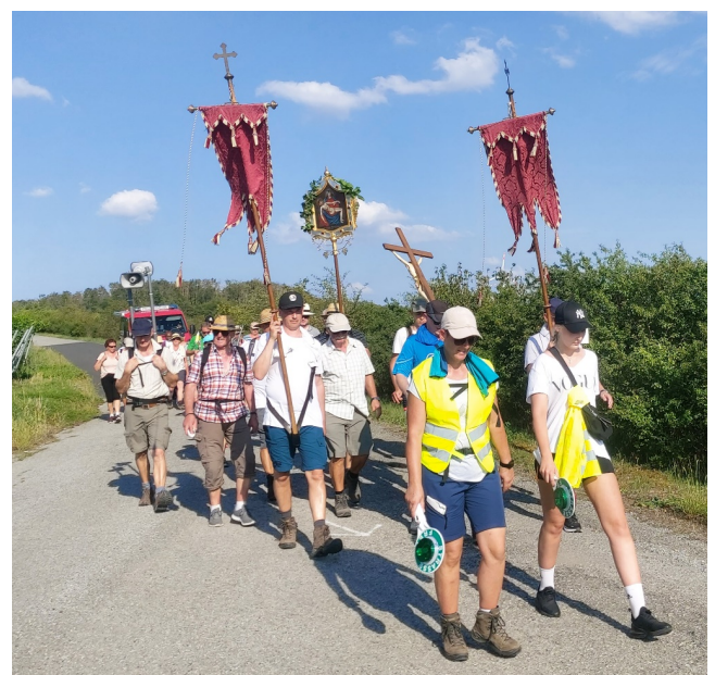
Dettelbachwallfahrt 2023 – letzte Meter vor Eibelstadt