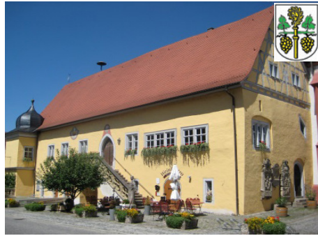
Markt Frickenhausen am Main